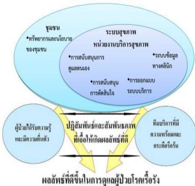
ภาพที่ ๓ รูปแบบการจัดการโรคเรื้อรัง Wagner’s chronic care model ค.ศ. ๒๐๐๒

๒. รูปแบบหุ้นส่วน และองค์ประกอบในการพัฒนาระบบการดูแลผู้มีปัญหา ระบบสุขภาพเรื้อรัง (World Health Organization, ๒๐๐๒) โดยองค์การอนามัยโลกพัฒนา WHO’s Innovative Care for Chronic Conditions Framework ในปี ค.ศ. ๒๐๐๒ ขึ้นเป็นรูปแบบการดูแลโรคเรื้อรัง ที่สอดคล้องและเหมาะสมกับบริบทของประเทศที่แตกต่างกัน โดยได้ให้ความสำคัญต่อเป้าหมายการจัดการโรค แบ่งออกเป็น ๓ ระดับ ได้แก่ ระดับนโยบาย ระดับระบบบริการสุขภาพและชุมชน และระดับของผู้ป่วยและครอบครัว เพื่อให้เกิดการดำเนินงานของภาคีเครือข่ายอย่างผสมผสานต่อเนื่อง และมีการปฏิบัติให้เกิดการเปลี่ยนแปลงในระยะยาว เพื่อส่งผลต่อผลลัพธ์สุขภาพของประชาชนที่ดีขึ้น ดังภาพที่ ๔