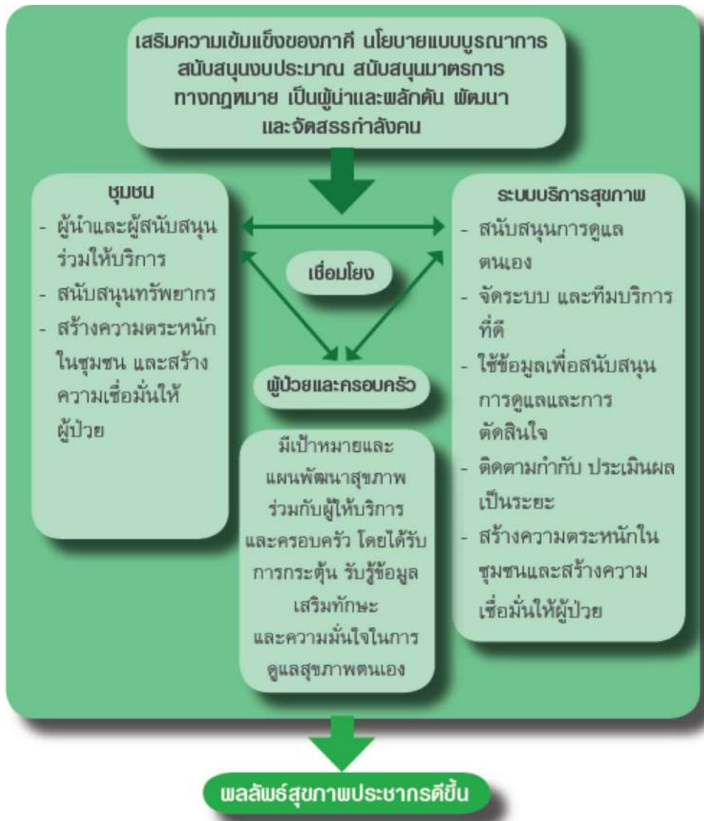
ภาพที่ ๔ รูปแบบหุ้นส่วนและองค์ประกอบในการพัฒนาระบบการดูแลผู้ที่มีปัญหาระบบสุขภาพเรื้อรัง (WHO, ๒๐๑๒)

สำหรับแนวทางการดำเนินงาน การประเมินคุณภาพ NCD Clinic Plus ในปีงบประมาณ พ.ศ. ๒๕๖๐ สำนักโรคไม่ติดต่อ กรมควบคุมโรค ได้พัฒนาด้านผลลัพธ์บริการ จากเดิมเน้นกระบวนการพัฒนาคุณภาพเท่านั้น สำหรับในปี ๒๕๖๐ ได้นำรูปแบบการจัดการโรคไม่ติดต่อของ Wagner มาปรับเป็นการดูแลแบบบูรณาการ ที่มีการประสานผลการดำเนินงานร่วมกัน และเชื่อมโยงกับบริการสุขภาพ การส่งเสริมป้องกันโรค ศูนย์รักษาพยาบาล และการฟื้นฟูสภาพ ในกลุ่มปกติ กลุ่มเสี่ยง และกลุ่มป่วย เพื่อลดความเสี่ยงต่อการเกิดโรค และลดอัตราป่วย ภาวะแทรกซ้อน อัตราการเสียชีวิต ของโรคไม่ติดต่อเรื้อรัง