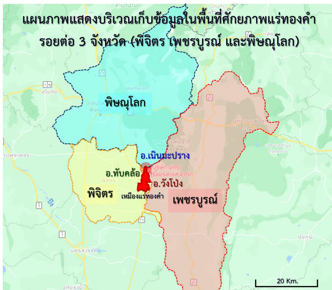
รูปที่ 3 แสดงพื้นที่การเก็บข้อมูล