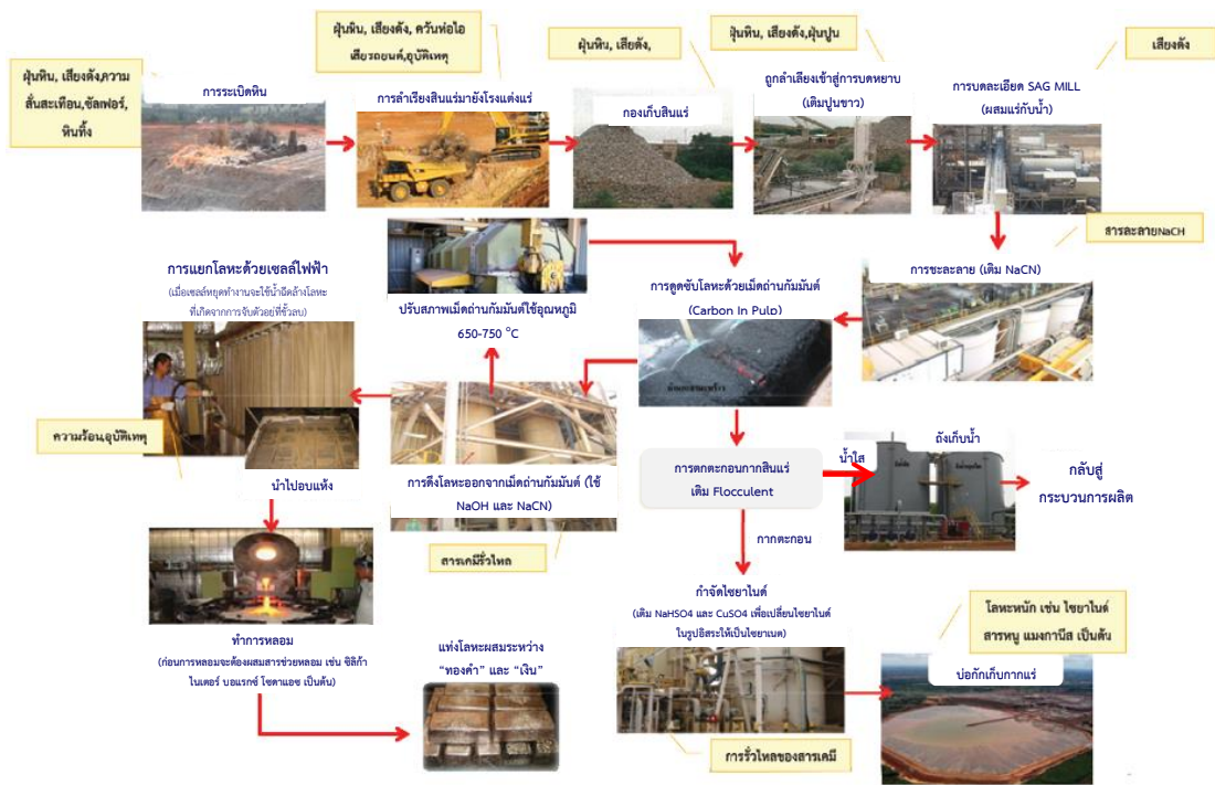
รูปที่ 2 แสดงแผนผังขั้นตอนการประกอบกิจการเหมืองแร่ทองคำ

เงินจะถูกฉีดล้างออกด้วยน้ำและนำไปเผา แล้วถลุงในเข้าหลอม ได้เป็นแท่งโลหะผสม และถูกส่งไปทำให้บริสุทธิ์ (Refining) เพื่อให้ได้เป็นโลหะทองคำบริสุทธิ์ 99.99% และโลหะเงินบริสุทธิ์ 99.95% ต่อไป