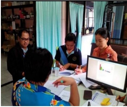
ประสานเก็บข้อมูลใน รพ.สต. อ.นครหลวง