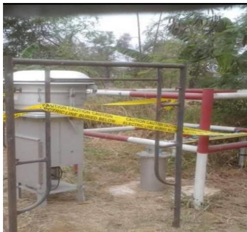
เครื่องมือเก็บตัวอย่างในบรรยากาศ พื้นที่ อ.นครหลวง จ.พระนครศรีอยุธยา