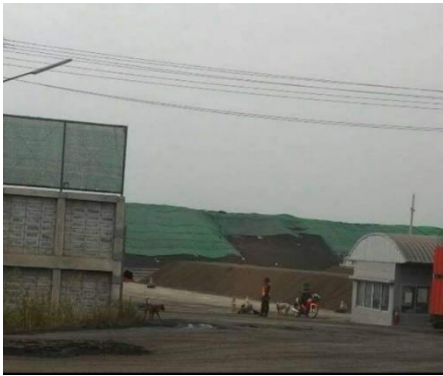
ทำเรือเก็บกองถ่านหินลิกไนต์