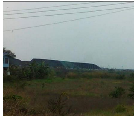
กองถ่านหินลิกไนต์ติดบริเวณนาข้าว