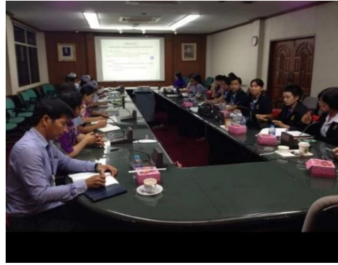
ประสานงานร่วมกับ สสจ.พระนครศรีอยุธยา