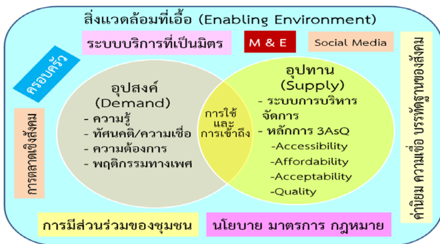
ภาพที่ ๒.๑ กรอบแนวคิดของยุทธศาสตร์ถุงยางอนามัยแห่งชาติ พ.ศ. ๒๕๕๘ - ๒๕๖๒

ยุทธศาสตร์ถุงยางอนามัยแห่งชาติฉบับนี้ใช้กรอบแนวคิดซึ่งประยุกต์จากแนวคิดการบริหารจัดการถุงยางอนามัยอย่างครบวงจร (Comprehensive Condom Programming) โดยคำนึงถึงปฏิสัมพันธ์ที่เป็นพลวัตและมีความสมดุลระหว่างองค์ประกอบหลักที่จำเป็น ๓ ส่วน คือ อุปสงค์ (demand) อุปทาน (supply) และสิ่งแวดล้อมที่เอื้อ (enabling environment) ดังภาพที่ ๑